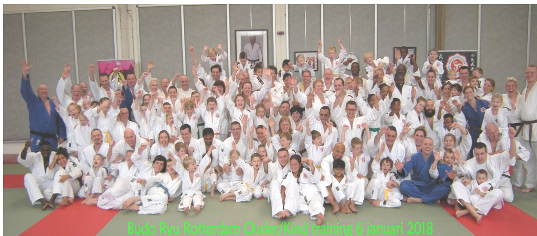
Budo Ryu Rotterdam Ouder/Kind training 6 januari 2018